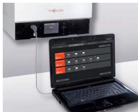
Der automatisierte hydraulische Abgleich mit Vitoflow erfolgt voll elektronisch direkt an der Anlage.